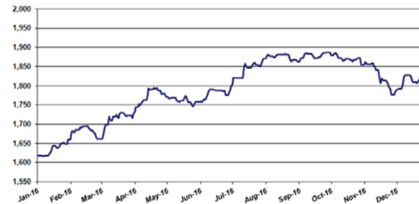
Grafik Perkembangan Nilai Aktiva Bersih per Unit Penyertaan Periode 1 Januari 2016 s/d 31 Desember 2016 (Dalam Rupiah Per Unit)

Nilai Aktiva Bersih per Unit Penyertaan pada tanggal 31 Desember 2016 adalah sebesar Rp. 1.812,474 atau mengalami kenaikan sebesar Rp. 193.264 atau 11,94% jika dibandingkan dengan Nilai Aktiva Bersih per Unit Penyertaan pada tanggal 31 Desember 2015, yaitu sebesar Rp. 1.619,210.