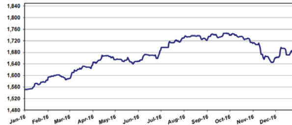
Grafik Perkembangan Nilai Aktiva Bersih per Unit Penyertaan Periode 1 Januari 2016 s/d 31 Desember 2016 (Dalam Rupiah Per Unit)

Nilai Aktiva Bersih per Unit Penyertaan pada tanggal 31 Desember 2016 adalah sebesar Rp. 1.679,330 atau mengalami kenaikan sebesar Rp. 128,170 atau 8,26% jika dibandingkan dengan Nilai Aktiva Bersih per Unit Penyertaan pada tanggal 31 Desember 2015, yaitu sebesar Rp 1.551,160.